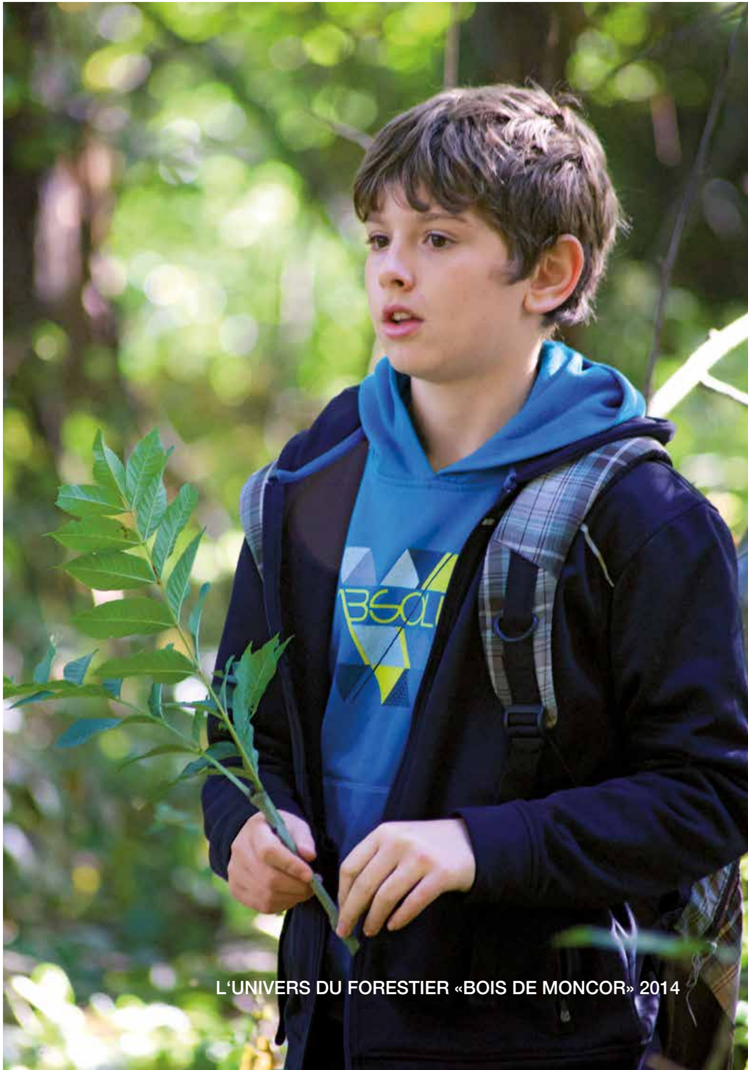
L'UNIVERS DU FORESTIER «BOIS DE MONCOR» 2014